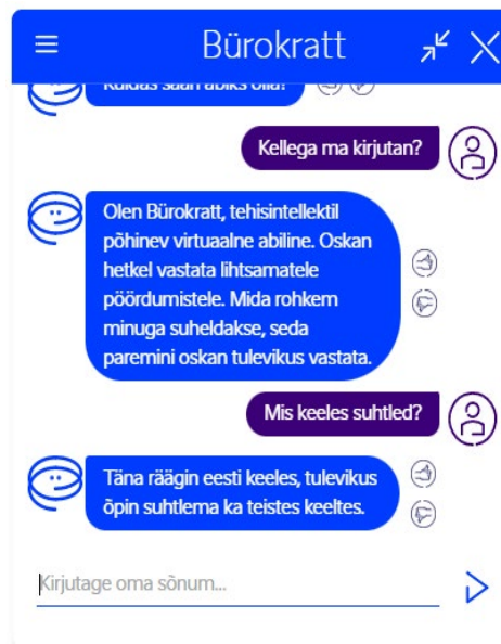
Joonis 3. Pika vastuse liigendamine eraldi teemade vastusteks.